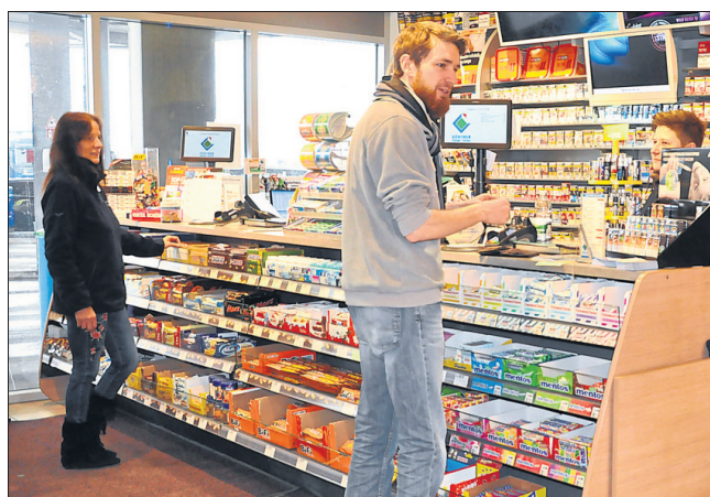
Im Tankstellenshop können Kunden sogar Vignetten für Österreich und die Schweiz erwerben.

So hat das Areal von Günther Energie + Service vor einigen Jahren ausgesehen. Mittlerweile sind eine zusätzliche Ausfahrt, der Pellets-Turm und eine Verlängerung der Pkw-Waschstraße hinzugekommen. Der zweispurige Kreislauf für zügigeren Verkehr ist momentan im Bau.